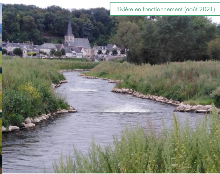
Rivière en fonctionnement (août 2021)